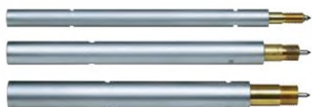
Удлинители для измерения глубоких отверстий (опционально)